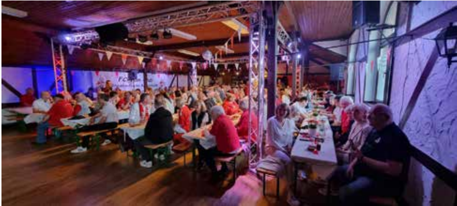
Die Rheinlandböcke sorgten für einen gut gefüllten Saal bei Manes am Bösch