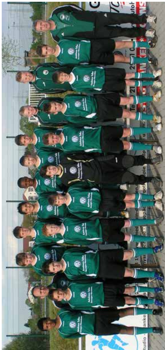
DJugend 2006/2007