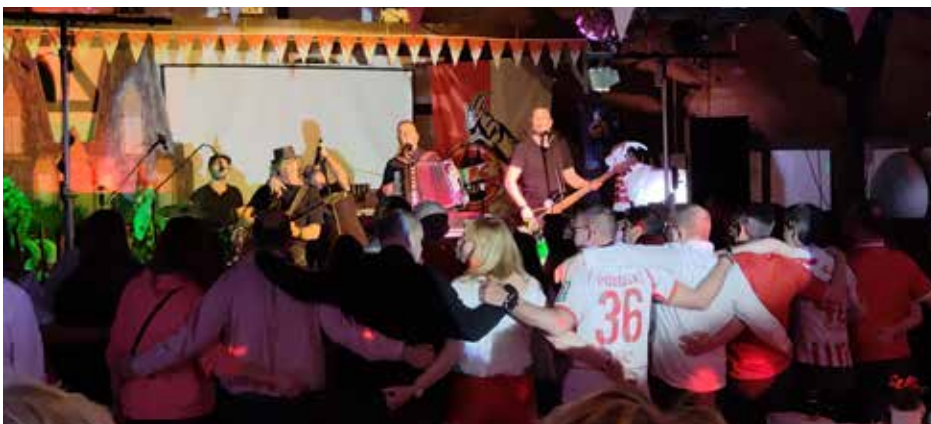
Die Räuber sorgten für reichlich gute Stimmung