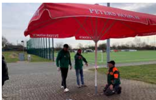
Neue Bodenhülsen für Sonnenschirme wurden montiert