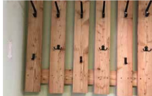
Die neue Garderobe mit mehr Stauraum