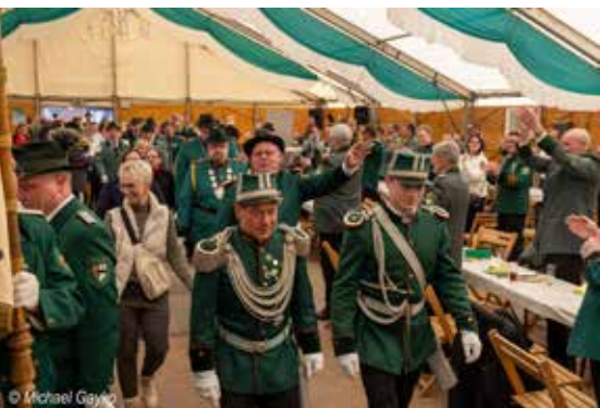
Einzug des neuen Jägerkönigs

Am Samstag, den 17. Mai 2025, folgt dann der große Krönungsball im Festzelt auf dem Schützenplatz in Nievenheim, der