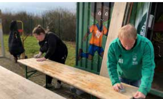
Auch Tisch- und Bankgarnituren wurden restauriert

Im gleichen Atemzug wurden die Tisch- und Bankgarnituren für den Bereich unter den Sonnenschirmen abgeschliffen und wurden neu lackiert, um für fri-