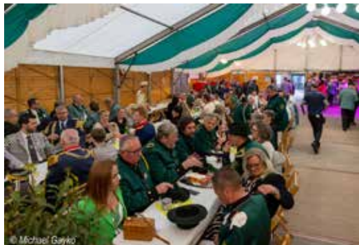
Vollbesetztes Festzelt im Vorjahr

Den Auftakt bildet das Stiftungsfest am Sonntag, den 11. Mai 2025. Ab 11 Uhr wird im Festzelt