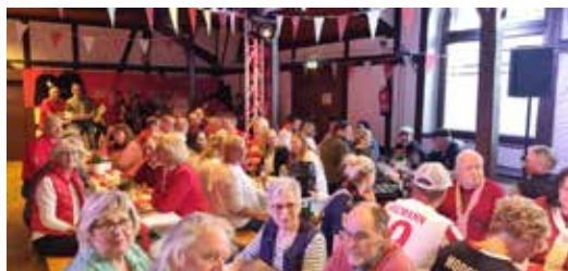
Oben: Der Saal bei Manes am Bösch Links: 3 Söck (Foto links: Rheinlandböcke)

Täglich 11.30-14.30 Uhr 17.30-23.30 Uhr Dienstag Ruhetag