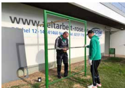
Die alte Torwand bekommt ein zweites Leben