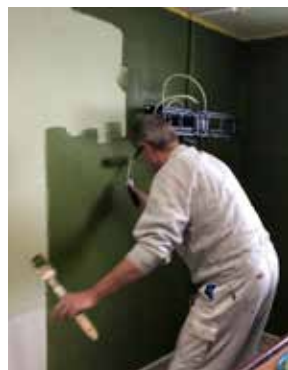
Neuer Anstrich für den Clubraum