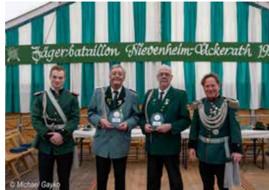
Ehrung der Mitglieder „70 Jahre und noch aktiv“ in 2024

Der Jägervorstand freut sich, neben den Jägern auch viele Bürgerinnen und Bürger aus Nievenheim, Ückerath und der Umgebung bei beiden Festen begrüßen zu dürfen. Gemeinsam möchte man schöne und gesellige Stunden bei Tanz und Musik verbringen.