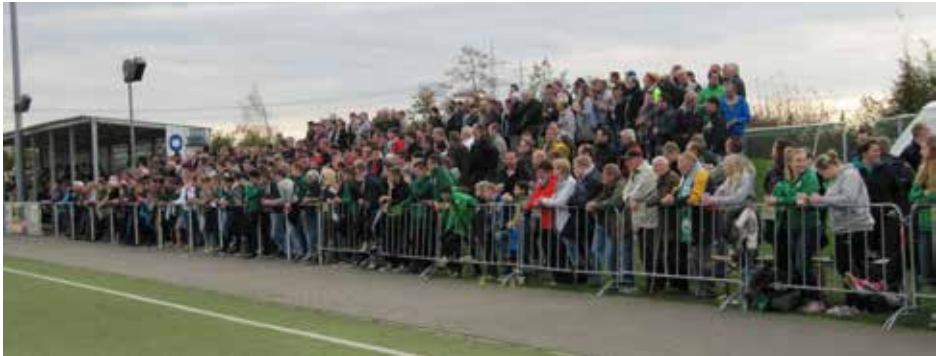
So voll hatte man die Ränge lange nicht gesehen