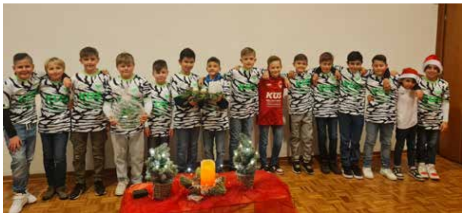
Die D7 im Seniorenheim Nievenheim

Ein Nachmittag voller Freude, Licht und Gemeinschaft – so wie Weihnachten sein soll.