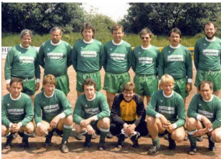
Alte Herren 1986