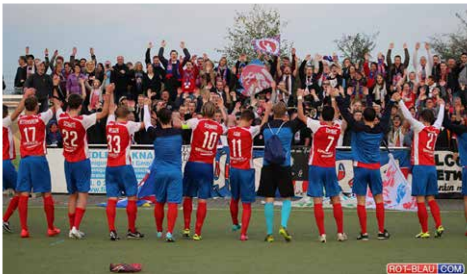
Der SV Wuppertal mit den mitgereisten Fans

absteiger aller Zeiten. Als letzte große Erinnerung, an jene kurze goldene Zeit des WSV, bleibt der 3:1-Erfolg am fünften Spieltag der Abstiegssaison über den FC Bayern München um ihren Kapitän Franz Beckenbauer. Die Bayern waren schon damals Weltspielspitze und hatten gerade den Europapokal der Landesmeister verteidigt. (Anmerkung: heute die Champions League.) Deutschland wurde mit einer starken Bayernfraktion 1974 Fußballweltmeister. Eigentlich