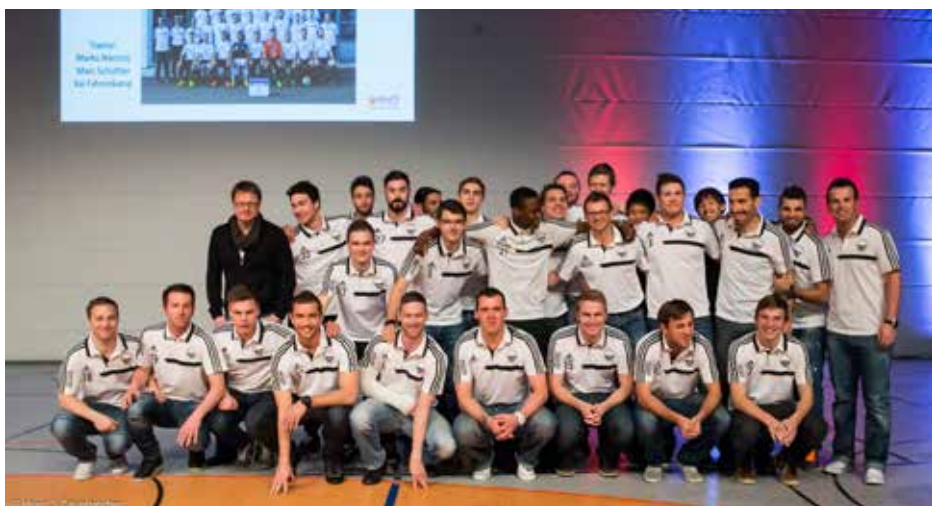
Mannschaft des Jahres 2014