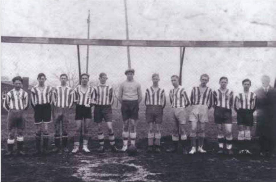
A Jugend des VdS Nievenheim 1930/1931