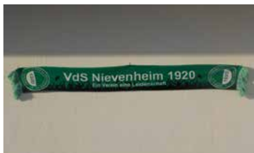
Der neue VdS Schal