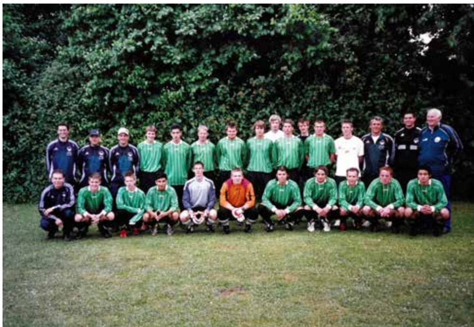
A Jugend 2007/2008 / Kreispokalsieger 2008