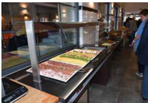
Sedle Blömche auf Tour