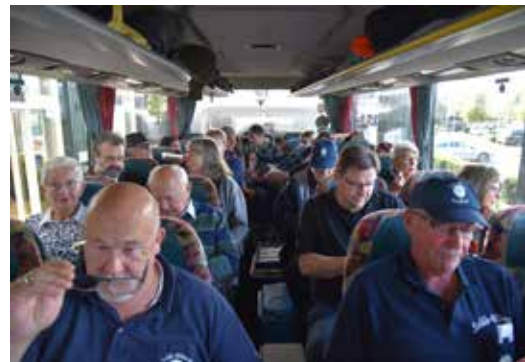
Selde Blömche auf Tour