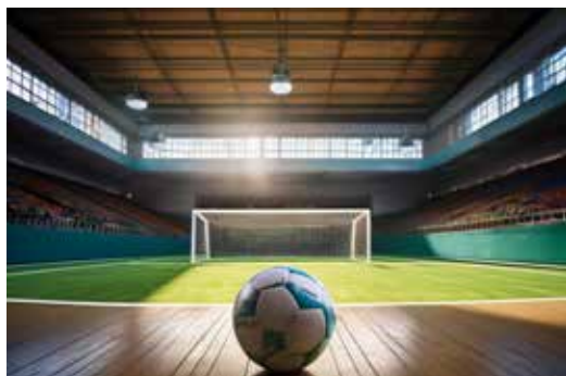
Hallenfußball Symbolbild