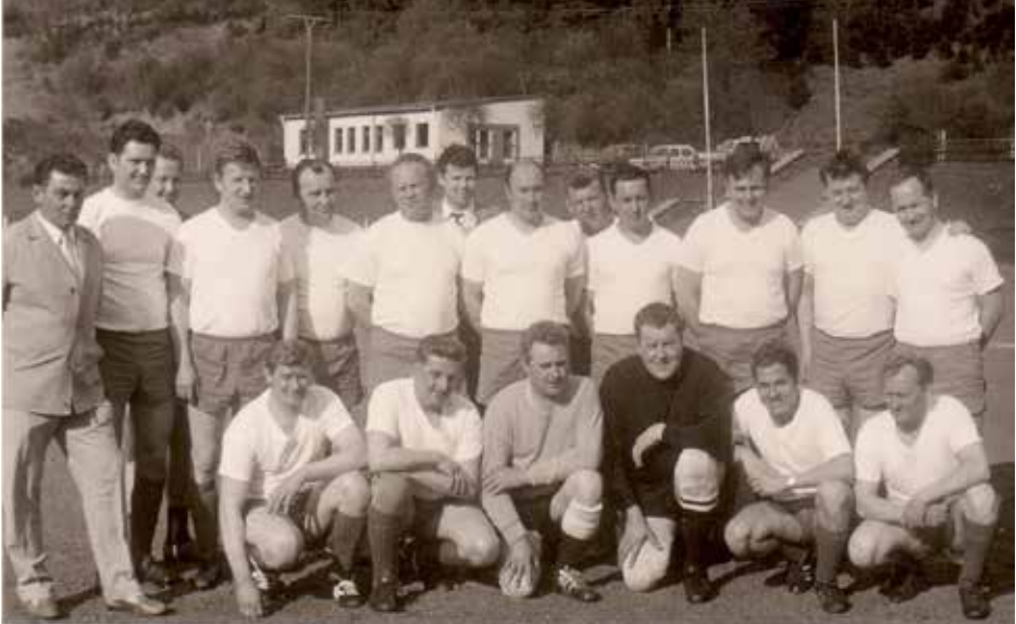
Alte-Herren 1970