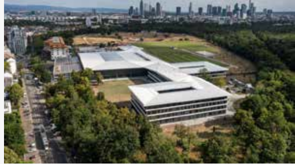
DFB-Campus Frankfurt ein Millionengrab

Das kostet Geld, das aber gut angelegt sein wird. Scheitert es vielleicht an der Durchlässigkeit und der Hierarchie in den Verbänden. Die Kreisverbände benötigen die Unterstützung der Landesverbände, die Landesverbände hängen am Tropf des DFB. Nur der DFB verfügt aktuell nicht über die finanziellen Mittel. Derzeit befindet sich der DFB in der größten finanziellen Krise in seiner über