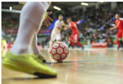
Action in der Halle

Nach vierjähriger Pause, ruft der Fußballkreis 5 Grevenbroich/Neuss wieder zu den Hallenkreismeisterschaften auf. Nach dem im Jahr 2020 mit 3:1 gewonnenen Finale, gegen den Landesligisten SC Kapellen, darf sich A-Kreisligist FC Delhoven seit vier Jahren als Kreishallenmeister bezeichnen. Seither wurde der Titel aus diversen Gründen (u.a. Coronapandemie, fehlende Hallenkapazitäten aufgrund Flüchtlingsproblematik, Energiekrise) nicht mehr ausgespielt. Doch das Comeback des Budenzaubers im Fußballkreis 5 Grevenbroich/Neuss ist jetzt beschlossene Sache. Darüber freuen sich Spieler und Vereine. Das Hallenspektakel war immer ein Highlight in der jährlichen Winterpause. 1989 wurden zum ersten Mal die Hallenkreismeisterschaften ausgerichtet. Das