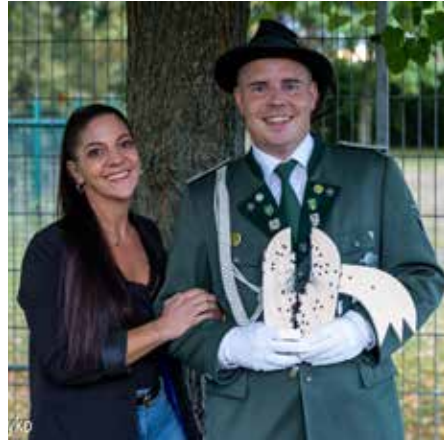
Hubertuskönigspaar 2024/25

Mit dem 255. Schuss gelang es Maximilian Schriewer, den Vo-