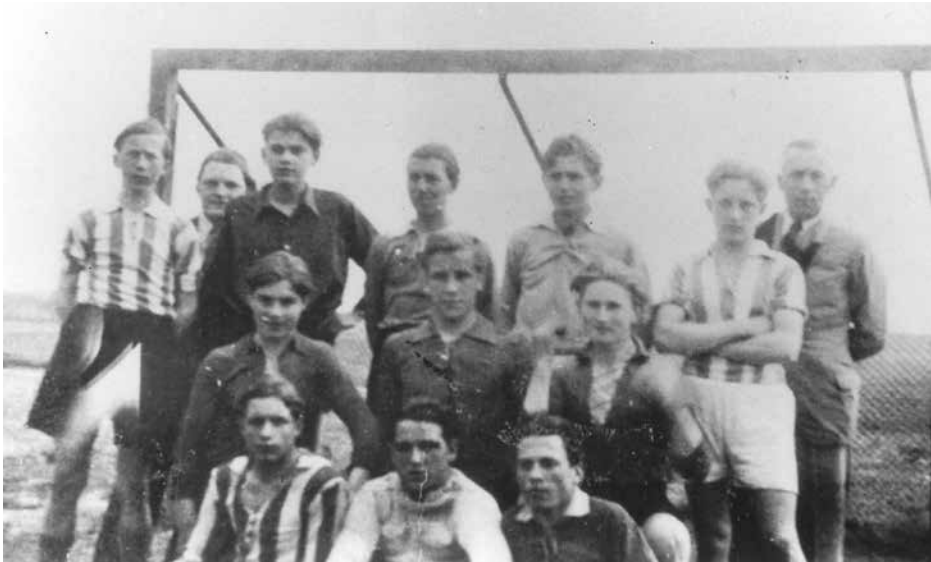
A-Jugend 1946