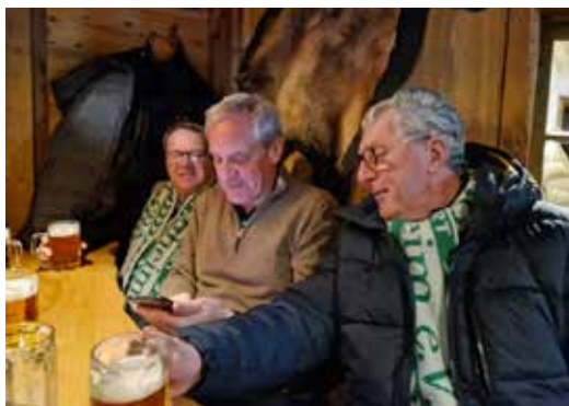
Beim Wilddieb