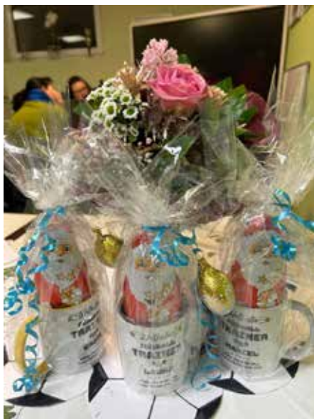
Kleines Präsent für die Trainer

Außerdem wünschen wir unserer Trainerin Laura, Gute Bes-