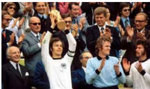
Am 7. Juli 1974 erfüllt sich für das Team um Kapitän Beckenbauer doch noch der Traum vom Titel: Deutschland ist Weltmeister.