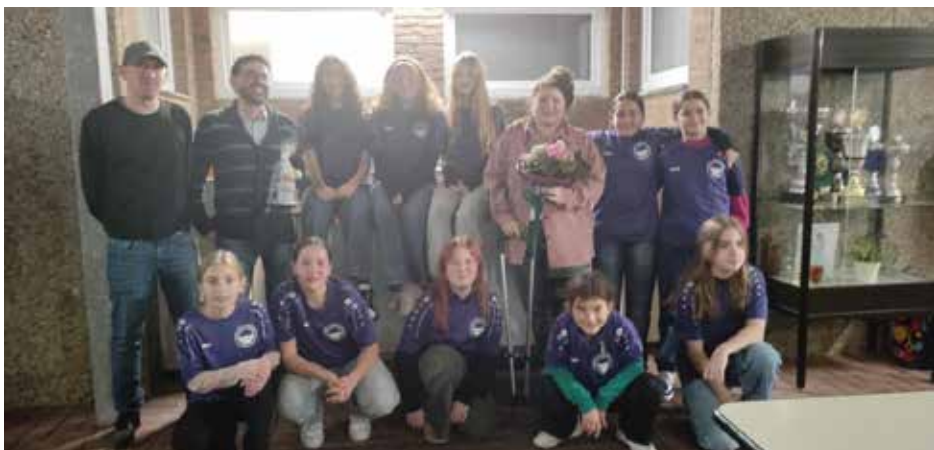
U13 Mädchen mit ihren neuen Aufwärmshirts