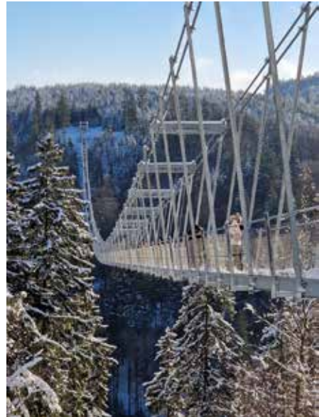
Der Skywalk