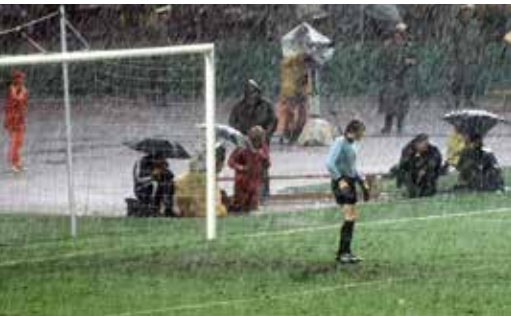
Sepp Maier bei der „Wasserschlacht von Frankfurt“

Heitere Spiele sind dieser Atmosphäre kaum möglich, die Voraussetzungen für ein Sommermärchen denkbar schlecht. Traumwetter wie bei der WM 2006 gibt es ebenfalls nicht. Die beiden letzten Zwischenrundenpartien der DFB-Elf finden im Dauerregen statt. Als „Wasserschlacht von Frankfurt“ schreibt das Spiel Deutschlands gegen Polen (1:0) Fußballgeschichte.