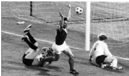
Mit seinem Siegtreffer für die DDR schreibt Jürgen Sparwasser 1974 Fußballgeschichte.

Ob Tatsache oder Legende, eines fest steht: Nach der unglücklichen Gruppenrunde läuft es für