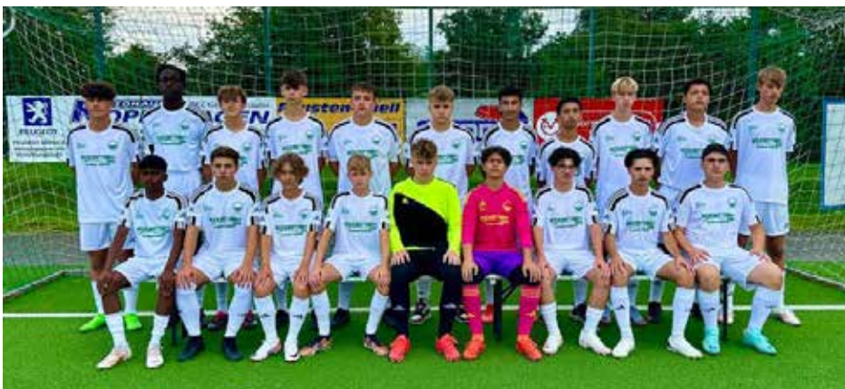
B-Jugend (U17)

Auch die Abwehr um den Kapitän ließ nur wenig zu und stand sicher. Der Torwart des VdS zeigte zudem einige hervorragende Paraden und konnte so den Vorsprung der Mannschaft fast die gesamte Spielzeit über verteidigen.