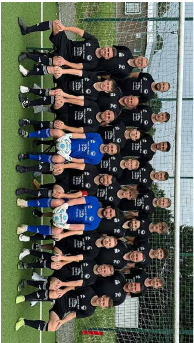
Die Erste