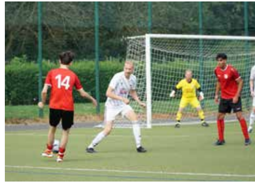
Szene aus dem Spiel Orken VdS III

Aber auch wenn die Gastmannschaft von einem „ernüchternden“ Auftritt der Nievenheimer spricht, traten die Jungs weder deprimiert die Heimfahrt an, noch gehen sie mutlos in die anstehenden Spiele. Den Insidern ist bekannt, dass Orken in den zurückliegenden Saisons immer wieder nur knapp den Aufstieg verpasst hat und auch diesmal zu den Favoriten zählt.