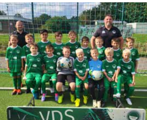
F1 mit neuen Trikots