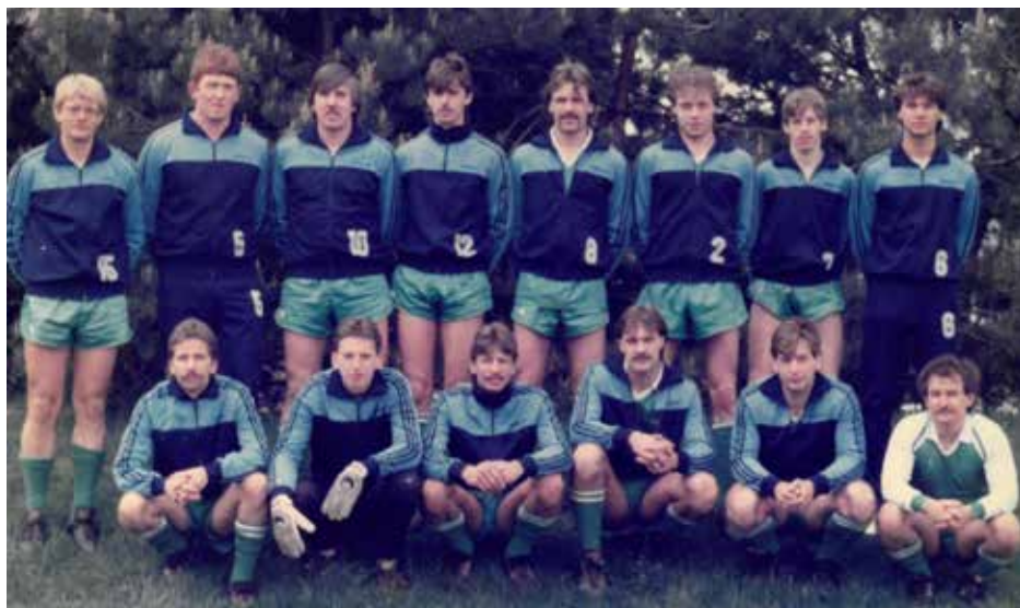
Zweite Mannschaft 1984/1985