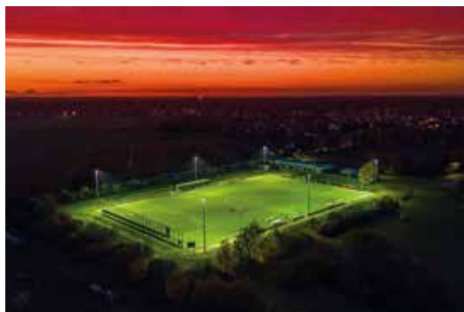
Der Sportplatz bei Nacht. Noch mit der alten Beleuchtung