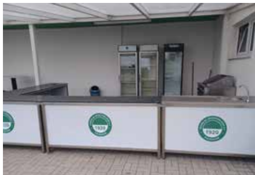
Der Cateringbereich beim VdS

Falls Interesse besteht, bitte beim Vorstand melden, um dann