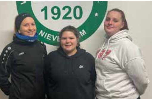
Unsere drei Neuzugänge