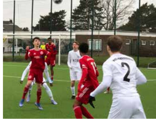
Kampf um den Ball in der Luft

zeigen wie gut in der Nievenheimer Jugend Fußball gespielt wird. Leider musste unser Team sofort in der Anfangsphase einen ersten Rückschlag hinnehmen, da man schon in der 7. Minute ein Elfmertor gegen sich bekam. In der 12. Minute konnte die Fortuna durch einen schönen Spielzug nachlegen. Wer aber dachte dass unsere Jungs sich jetzt hängen lassen, der wurde eines Besseren belehrt. Nachdem sie die anfängliche Nervosität abschütteln konnten, hielten sie immer besser mit und erspielten sich die ersten Chancen. Es wurde ein tolles Spiel für alle Zuschauer, indem die Gäste kurz vor der Halbzeit mit einem Doppelschlag auf 4:0 erhöhen konnten. In der zweiten Halbzeit blieb das Tempo sehr hoch und unsere Jungs spielten weiter darauf einen Treffer gegen den großen Favoriten zu erzielen. Letztendlich kamen noch drei weitere Treffer für die Gäste hinzu, womit nach 80 gespielten Minuten auf der Anzeigetafel ein 0:7 stand. Alles in allem konnten sich die Jungs aus Nievenheim mehr als teuer verkaufen und