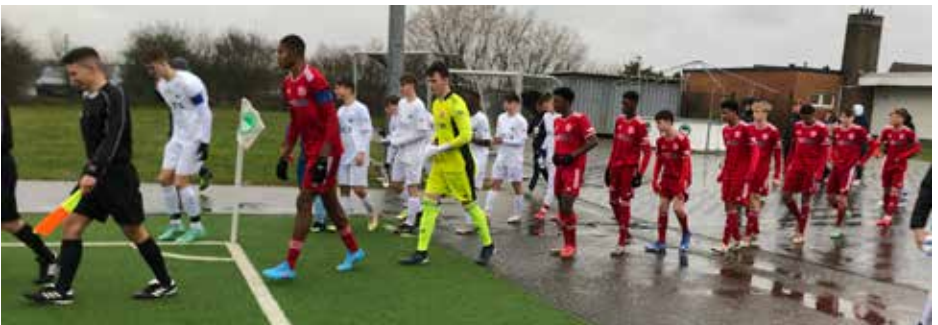
Einmarsch der Teams vom VdS und Fortuna Düsseldorf

war ebenfalls die Teilnahme am Niederrheinpokal, wo man mit der Fortuna den schwerstmöglichen, aber sicherlich auch attraktivsten Gegner zugelost bekam. Trotz "Fritz Walter Wetter", kamen über 200 Zuschauer zum Spiel und die Jungs durften sich erstmals vor so einer großen Kulisse beweisen. Natürlich waren die Kräfteverhältnisse im Vorhinein klar geregelt. Zum einen spielt der Gegner aus Düsseldorf nicht nur zwei Ligen höher, sondern wie auf dem Feld klar zu erkennen war, gab es bedingt durch den Altersunterschied auch erhebliche körperliche Unterschiede. Trotzdem war es unser Ziel hier nicht nur die Bälle weit nach vorne zu schlagen, sondern den Zuschauern zu