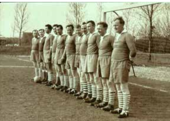
Alte Herren 1965