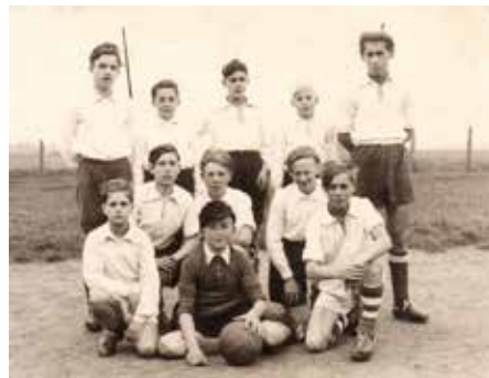
C- Jugendmannschaft Saison 1948-1949