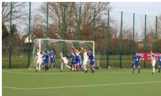
Spielszene aus dem Spiel gegen SV Glehn