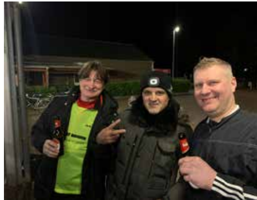
Gemütliches Beisammensein nach dem Spiel gegen den SSV Delrath