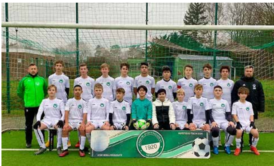
C2-Jugend 2021/22

Zuvor hatten sie in der Vorrunde (Qualifikation) mit 11 errungenen Punkten den siebten Platz belegt.