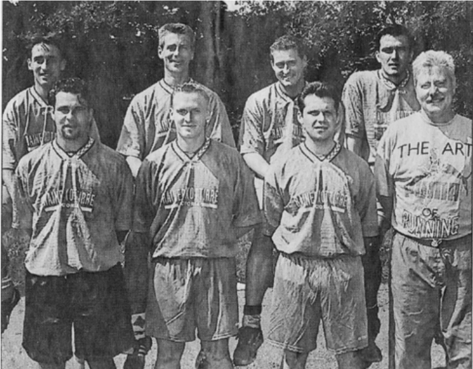
Das Nievenheimer Starensemble 1998/99