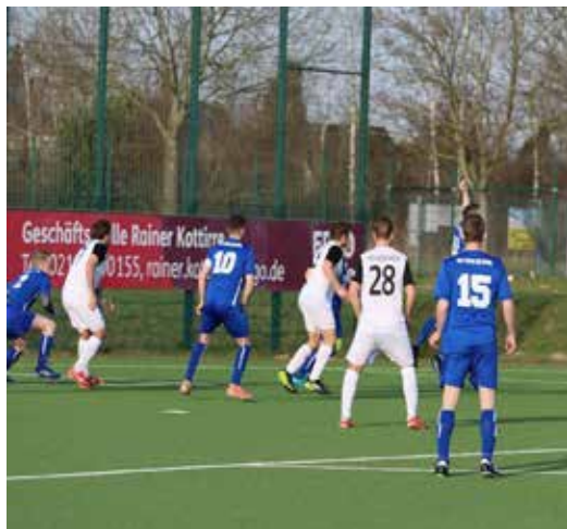
Spielszene aus dem Spiel gegen SV Glehn