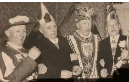
1953