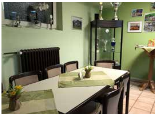
Das VdS-Clubheim