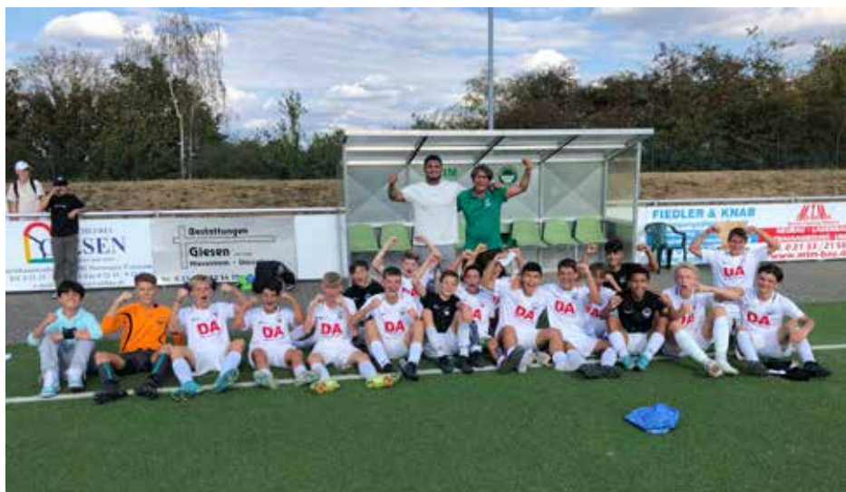
C1-Jugend 2021/2022