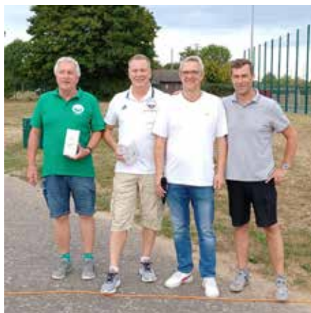
Verabschiedung unserer scheidenden Vorstandsmitglieder