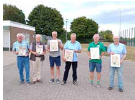
Die Jubilare 2022