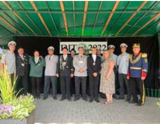
Abordnung Nievenheimer Schützen in Brühl