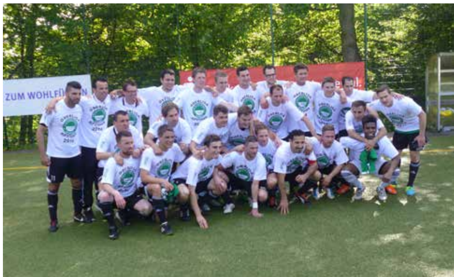
Aufstiegsmannschaft in die Oberliga

mit denen man vom Haushalt her vielleicht auf Augenhöhe lag. Der Klassenerhalt wäre eine riesen Sache aber ein schwieriges Unterfangen, so die Meinung der Verantwortlichen. Eine einmalige Saison wartete auf Nievenheim. Der VdS reiste zu Vereinen an, deren Sportstätten