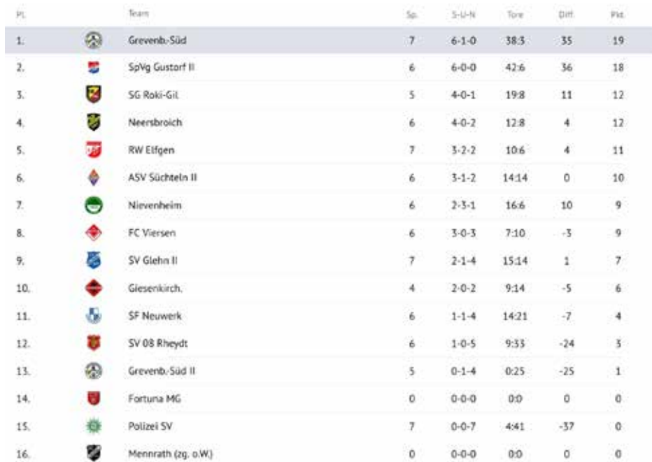
Tabelle Kreisliga Niederrhein, Gruppe 8, Stand: 27.09.22