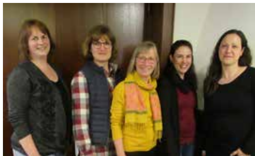
Der Vorstand im Gründungsjahr

Unser Motto: „ Wir bewegen Menschen “ setzen wir auf vielfältige Weise um. So gibt es an jedem Tag der Woche Angebote für Kinder und Erwachsene. Wir empfehlen einen Blick auf unsere Homepage www.vbn-nievenheim.de , Informationen zu allen Gruppen sind hier eingestellt.