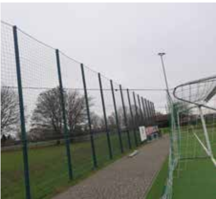
Die Tornetze wurden neu befestigt