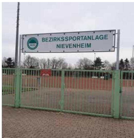
Das erneuerte Eingangsschild der Sportanlage