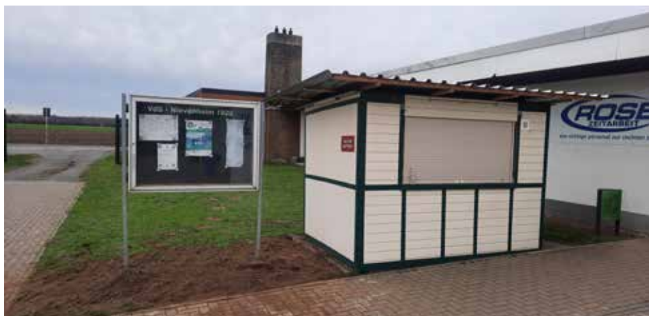
Der neue Schaukasten neben dem Kassenhäusschen am Kunstrasenplatz