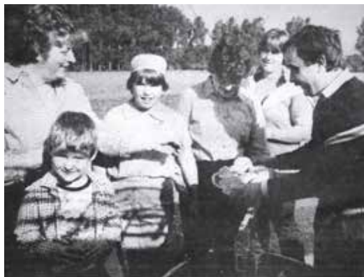
Große Stärkung auch für kleine Wanderer: Beim Wandertag in Nievenheim sorgten zahlreiche Helfer für Kaloriennachschub