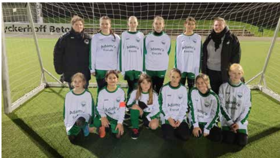
Die VdS Mädchenmannschaft

Nun hieß das nächste Ziel weitere Mädchen dieser Jahrgänge für unsere Mannschaft zu begeistern und natürlich ein Trainerteam zusammenzustellen. Dazu wurde großflächig im Stadtgebiet Dormagen Werbung geschaltet. Das Interesse war erfreulicherweise sehr groß und auch ein Trainerteam konnte schnell gefunden werden. So durfte unsere neue Trainerin