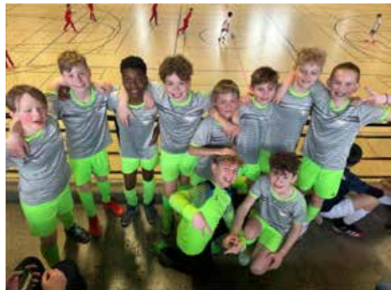
E-Jugend beim Wintercup

Alsdorf 2 gewonnen. Anschließend folgte ein 2:1 gegen Armunia Eilendorf und ein 6:0 gegen die Zweitvertretung des Gastgebers, Amicitia Schleiden 2. Es folgte ein weiterer Sieg im fünften Spiel gegen Eintracht Warden 3, 2:0 und auch das abschließende Spiel gegen Eintracht Warden 2 konnten die Jungs für sich entscheiden. Das 7:0 im letzten Spiel sorgte dann auch für eine mehr als ansehnliche Bilanz am Ende der Gruppenphase. Unsere Mannschaft belegte den ersten Platz mit der vollen Punktausbeute und einem Torverhältnis von 19:1. Somit musste