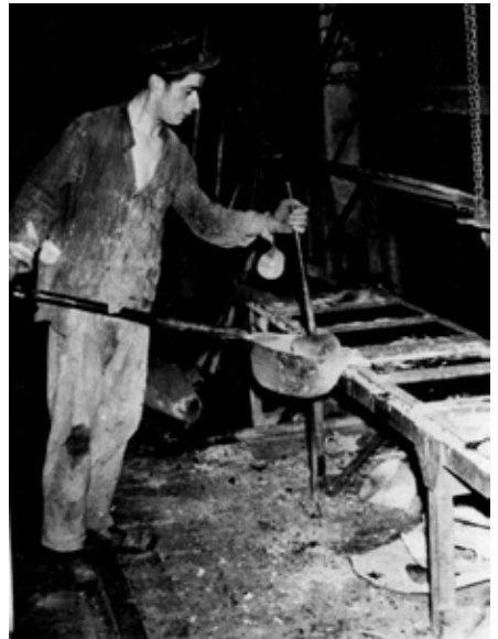
Arbeiter der Zinkhütte (links und oben)