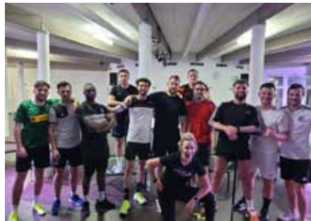
Die Zweite während und nach dem Spinning

Neben den Trainingseinheiten wurden ebenfalls insgesamt vier Testspiele vereinbart. Man konnte schnell merken, dass das angezogene Tempo im Training seine Früchte tragen sollte. So konnte man drei der vier Testspiele gewinnen und musste lediglich gegen den Nachbarn und in der Kreisliga A angesetzten TUS Hackenbroich eine Nieder-