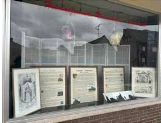
Die Ausstellung im Schaufenster von Blumen Heide