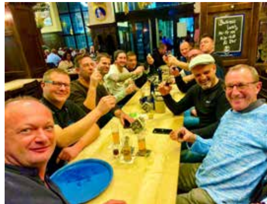
Die alte Herren vor dem Hotel Excelsior und im Gaffel am Dom