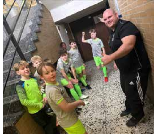
Die Mannschaft mit Teammanager Oliver