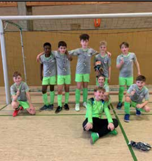
E-Jugend beim Wintercup