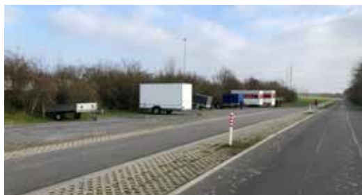
Dauerparker an der Südstraße vor dem Sportplatz

Die Beschwerden rund um die Südstraße haben zugenommen: Vor der Sportanlage stehen schon seit längerer Zeit viele Anhänger und Firmenfahrzeuge. Dadurch stehen – insbesondere an den Tagen, an denen der VdS Nievenheim Trainingsbetrieb und Meisterschaftsspiele hat – viele Parkplätze nicht zur Verfügung, auch nicht für die Gästemannschaften und ihren Anhang. In der Folge nimmt der Parksuchverkehr und das Abstellaukommen in den benach-