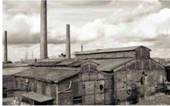
Zinkhütte Delrath

Viele Bürger aus Nievenheim, Ückerath und Delrath werden sie sicher noch gut kennen. Gemeint ist das 1971 stillgelegte und 1973 abgerissene Zinkhüttenwerk am Ortsausgang von Delrath. Viele Jahrzehnte bot das abgerissene Unternehmen den Beschäftigten wirtschaftliche Sicherheit und eine Zukunftsperspektive. Die Geburtsstunde der Fabrik fiel auf das Jahr 1911. Damals hatte die Rheinisch-Nassauische Bergwerks- und Hütten AG auf der Delrather Heide die Zinkhütte und Schwefelsäurefabrik errichtet, 1922 schließlich an die Aktiengesellschaft für Bergbau, Blei- und Zinkfabrikation zu Stollberg und in Westfalen verpachtet. 550 bis 600 Mitarbeiter arbeiteten damals in der Fabrik, am Ende waren es noch 150. Erzeugt wurden Hüttenroh-zink und Zinkstaub, als Abfall-