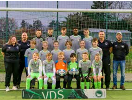
E-Jugend 2022/23

lernt, lernt Hans nimmermehr“, kann man das auf deine Trainingsarbeit und Führung übertragen?