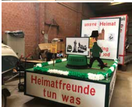
Der Wagen der Hubertuskorps der St. Sebastianus Schützenbruderschaft

heim und Ückerath in besonderem Maße gewürdigt. Dass der Vorstand der Heimatfreunde sich bei den Hubertusschützen erkenntlich zeigte und diese bei der Präsentation der Großfackel am Mittwoch vor Schützenfest mit reichlich Kaltgetränken be-