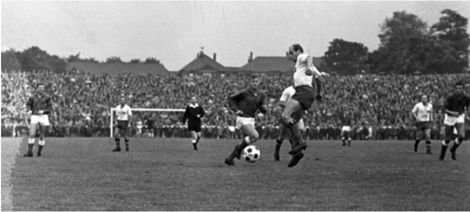
Am ersten Spieltag der neuen Fußball-Bundesliga am 24. August 1963 trennen sich Preußen Münster und der Hamburger SV 1:1 (0:0)

Meister 1860 München, der 1. FC Nürnberg, Eintracht Frankfurt, der Karlsruher SC und der VfB Stuttgart. Hinzu kamen der Südwestdeutsche Meister 1. FC Kaiserslautern und der 1. FC Saarbrücken aus der Oberliga Südwest. Berlin wurde vertreten durch Hertha BSC, den Meister der Berliner Stadtliga.