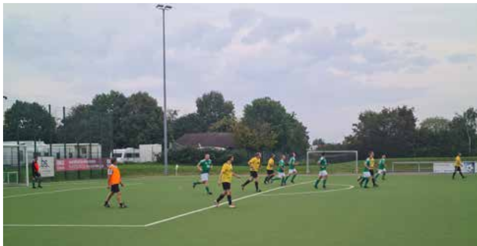
Spieldzene aus dem Spiel gegen Büttgen

ten gute Stimmung nur durch die kleinere Verletzung eines unserer Spieler, welcher an diesem Abend schneller als seine neuen Schuhe zu sein schien. Nach einer eher unglücklichen Aktion knickte er um und die Schadenfreude überwiegte der Angst einer schlimmeren Verlet-