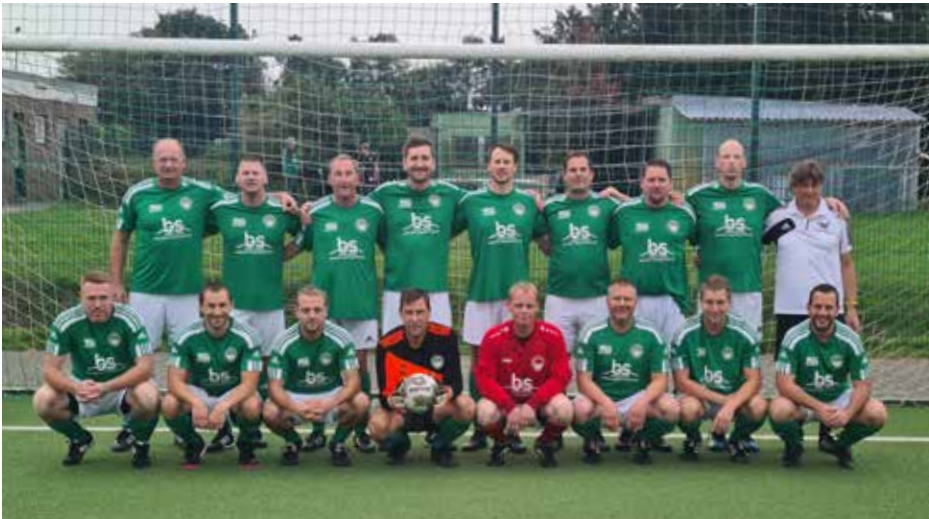
Das Aufgebot der Alte Herren gegen Büttgen