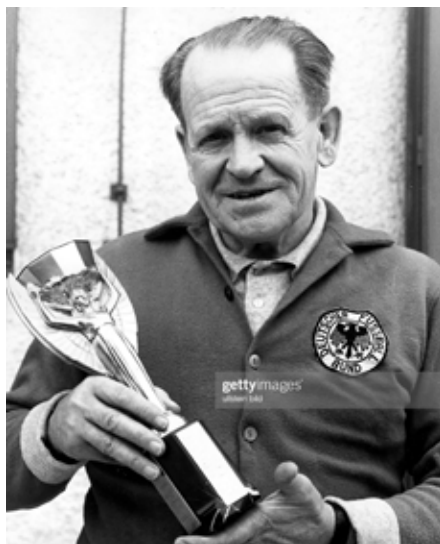
Sepp Herberger

Sepp Herberger, Bundestrainer 1950 bis 1964