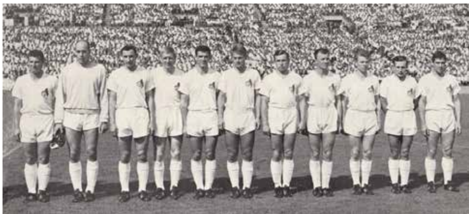
1. FC Köln Deutscher Meister 1963/64

Oberligen ab. Die Meisterschaft wurde in einer Doppelrunde mit 16 Mannschaften ausgespielt. Für die Bundesliga zugelassen wurden aus der Oberliga Nord der Norddeutsche Meister Hamburger SV, Werder Bremen und Eintracht Braunschweig. Aus der Oberliga West kamen fünf Vereine: der amtierende Deutsche Meister Borussia Dortmund, der deutsche Vize-Meister und Westdeutsche Meister 1. FC Köln, der Meidericher SV, Preußen Münster und Schalke 04. Auch aus der Oberliga Süd kamen fünf Vereine: der Süddeutsche